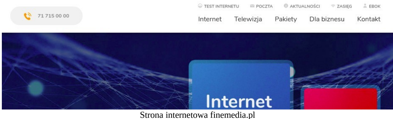
Strona internetowa finemedia.pl

Otwórz dowolną przeglądarkę internetową, a następnie wpisz adres strony internetowej finemedia.pl. Po otwarciu strony przejdź do zakładki EBOK która znajduje się w prawym górnym rogu ekranu.